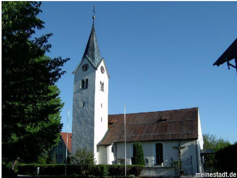
Kirche St. Gallus, Sigmarszell, Gemeinde Sigmarszell, Landkreis Lindau